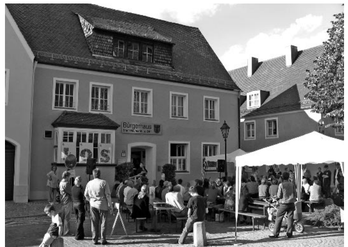
Bürgerhaus Neumarkt: Veranstaltung zu „LOS“

Offen für alle - Das Bürgerhaus steht vielen Gruppierungen offen. Regelmäßig kommen dort über 20 Gruppen zusammen.