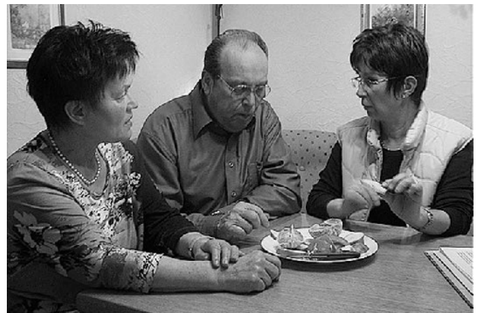
Beratungsgespräch bei der Vermittlungsstelle

Ein Ansprechpartner - Viele Leistungen - Die Betroffenen haben den Vorteil, dass ihre Bedürfnisse genau berücksichtigt werden können, und dass sie einen Ansprechpartner für verschiedene Dienstleistungen haben.