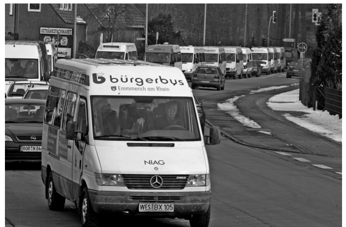
Bürgerbustreffen in Ahaus 2005

Engagement von allen Seiten - Nicht nur vom Bürgerbusverein, auch seitens der Verwaltung und des Verkehrsunternehmens muss ein Engagement eingebracht werden, das sich gelegentlich auch außerhalb des normalen Dienstbetriebes bewegt.