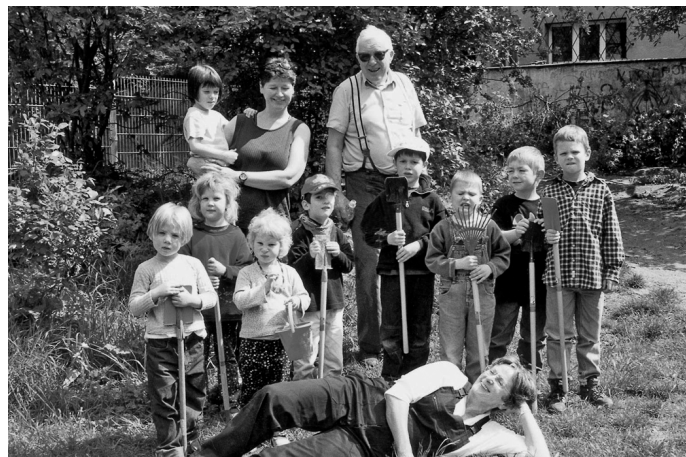
Große helfen Kleinen bei Gartenarbeiten

Bereicherung für die Kinder - Ehrenamtliche bringen zusätzliche handwerkliche, naturwissenschaftlich-technische, musische Kenntnisse in den pädagogischen Alltag ein. Sie unterstützen und fördern einzelne Kinder, Kleingruppen oder Projektarbeit.