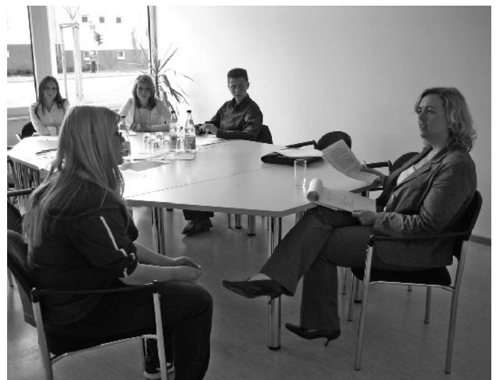
Bildungspatin im Gespräch

Erfahrungsaustausch der Bildungspaten - Bei einem monatlichen Treffen tauschen die Bildungspaten aktuelle Informationen des Bildungs-, Ausbildungs- und Arbeitsmarktes aus und besprechen einzelne Fälle. Zudem können Paten und Kooperationspartner bereits erstellte Materialien und Informationen wie z.B. einen Beratungsführer „Bewerbung und Vorstellungsgespräch“ oder Firmendatenbanken nutzen.