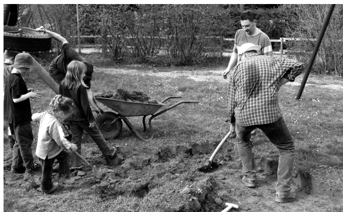
Dürmentinger bauen einen Spielplatz

Gleichstellung Gemeindeverwaltung und Bürger - Politiker und Mitarbeiter der Gemeinde leisten einen wesentlichen Beitrag, indem sie selbst bei den Projekten ehrenamtlich mitarbeiten.