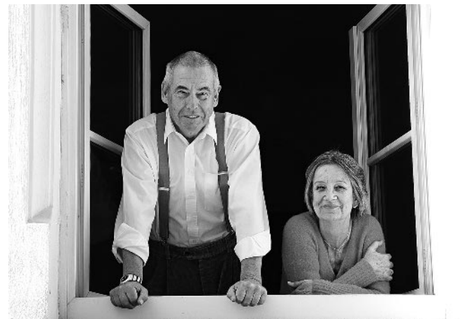
Wohnen zu Hause

Kompetente Begleitung der Planungen - Die Arbeitsgruppe für Altersforschung und Sozialplanung begleitete den Diskussionsprozess fach- und sachkundig: Sie moderierte die Arbeitskreise, beurteilte die Realisierbarkeit von Maßnahmen und ermöglichte eine Vernetzung von Projekten.