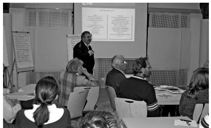
Workshop 2007 „Demografie im Auerbergland“

So entstand die Idee, die Gemeinden um den Auerberg mit ihren geschichtlich-kulturellen, wirtschaftlichen und naturräumlichen Gegebenheiten zu vernetzen, mit gemeinsamen Aktivitäten und Initiativen zu beleben und zu stärken. „Gemeinsam zum Wohle aller für ein schönes Leben“ lautet der Leitsatz der derzeit 13 Mitgliedsgemeinden. Ziel ist es, den Wandel in den einzelnen Orten aktiv zu gestalten, Eigenverantwortung und Bürgerschaftliches Engagement zu stärken, neue Formen der Kooperation zwischen Kommunen und privaten Partnern aufzubauen und mit fachlicher Unterstützung nach umsetzungsorientierten Herangehensweisen zu suchen.