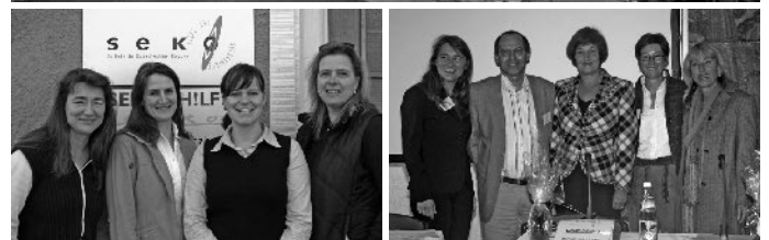
Selbsthilfekontaktstellen Bayern e.V. im Juli 2003, u.l.: Seko Bayern, u.r.: mit Staatsministerin Christa Stewens