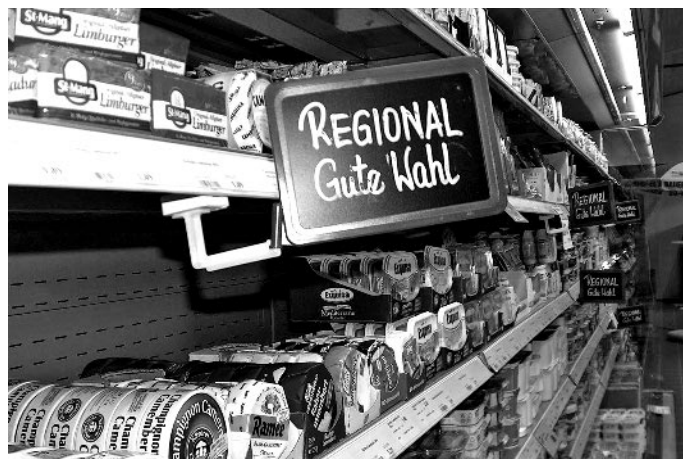
Ladentheke Dorfladen Alte Schule Niederrieden

Vernetzung der Dorfläden - Ein Netzwerk mit fünf weiteren Dorfläden im Allgäu, die sich zu einer Einkaufsgemeinschaft zusammengeschlossen haben, ermöglicht eine gute Preisgestaltung.